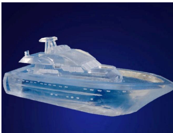
Luxe Jacht presentatie