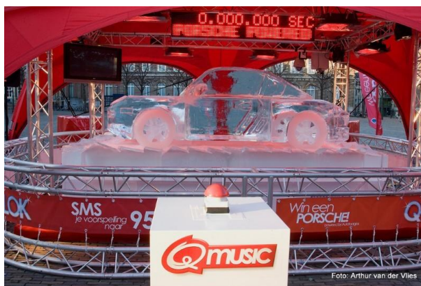
Q-Music Porsche van ijs