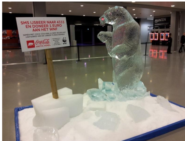
WNF "Red de ijsbeer"