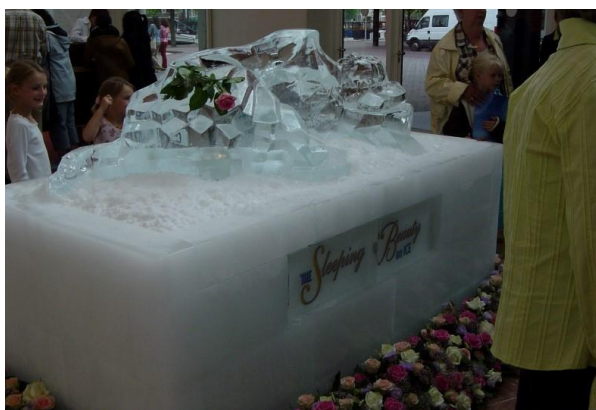
Premiere Sleeping Beauty on Ice